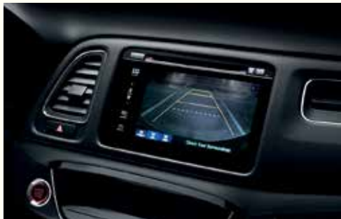
Багатопроєкційна камера заднього огляду*