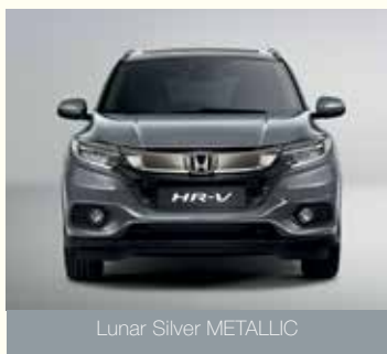
Lunar Silver METALLIC