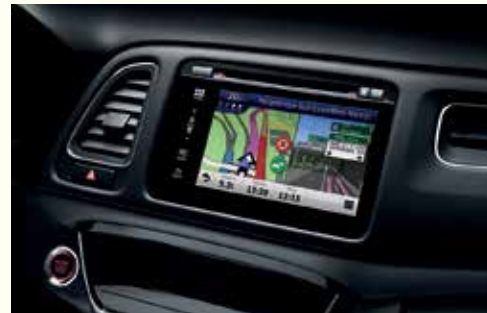
Навігаційна система Garmin*