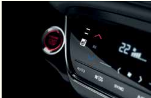
Сенсорна панель клімат-контролю