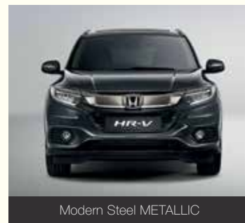
Modern Steel METALLIC