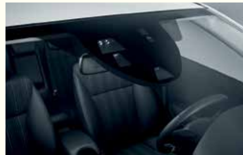
Передові системи безпеки