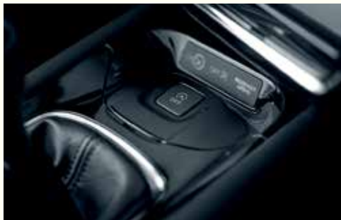
Система Айдл-Стоп (Idle Stop)