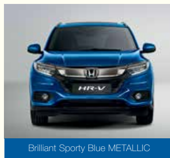
Brilliant Sporty Blue METALLIC

Зверніть увагу, що кольори на папері можуть дещо відрізнятися від того, як вони виглядають насправді