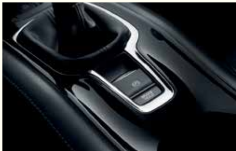
Електромеханічне паркувальне гальмо з функцією автоматичного утримання