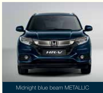
Midnight blue beam METALLIC