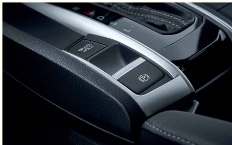
Паркувальне гальмо з електроприводом