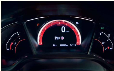
Мультинформаційний дисплей панелі приладів