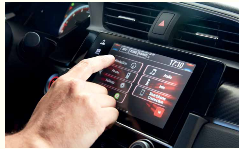
Мультимедійна система Honda Connect (окрім Comfort)