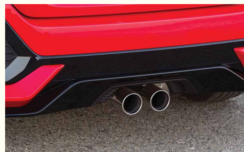
Подвоєні патрубки випускної системи (для Sport та Sport Plus)