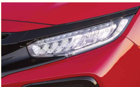
LED-фари (Sport та Sport Plus)