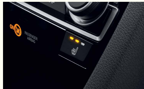
Підігрів передніх сидінь