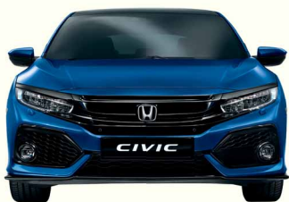
BRILLIANT SPORTY BLUE

Зверніть увагу, що кольори на папері можуть дещо відрізнятись від того, як вони виглядають насправді